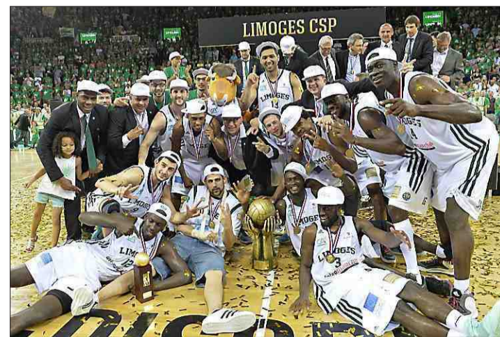
● Un 11 e titre pour le CSP qui a battu Strasbourg (82-75), samedi soir.

Limoges est le deuxième club le plus titré en ProA derrière Villeurbanne (17 sacres). Malgré des péripéties vécues lors de la phase régulière, le Cercle Saint-Pierre a sauvé sa saison en décrochant ce deuxième titre d'affilée grâce à un